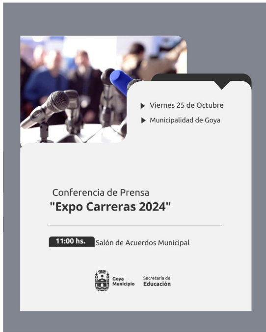
Conferencia de Prensa

El viernes 25 en el Salón de Acuerdos de la Municipalidad a las 11 horas se hará la presentación de la Edición 2024 de la Expo Carreras.