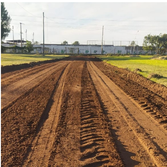
PISTA DE ATLETISMO