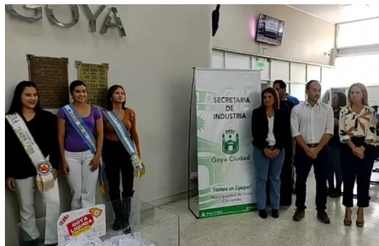
Dirección de Prensa-Municipalidad de Goya

Con esta herramienta, la gestión municipal permitió en su 8ª edición, la movilización e impulso de la economía local y la dinamización del consumo.